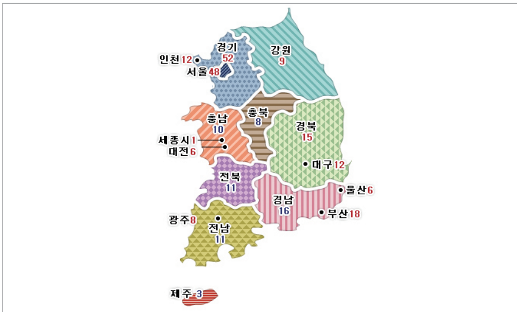
〈그림 1〉 지역별 국회의원 선거구