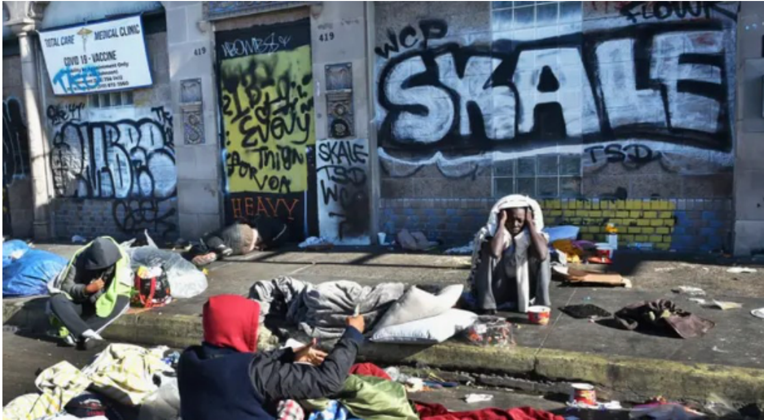
그림 3. 캘리포니아 2022년 2월의 거리 모습