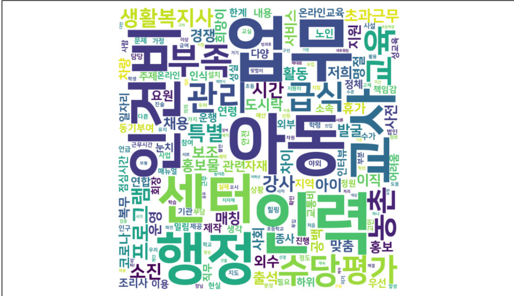
〈그림 3〉 인터뷰 전체 내용 텍스트 분석 시각화